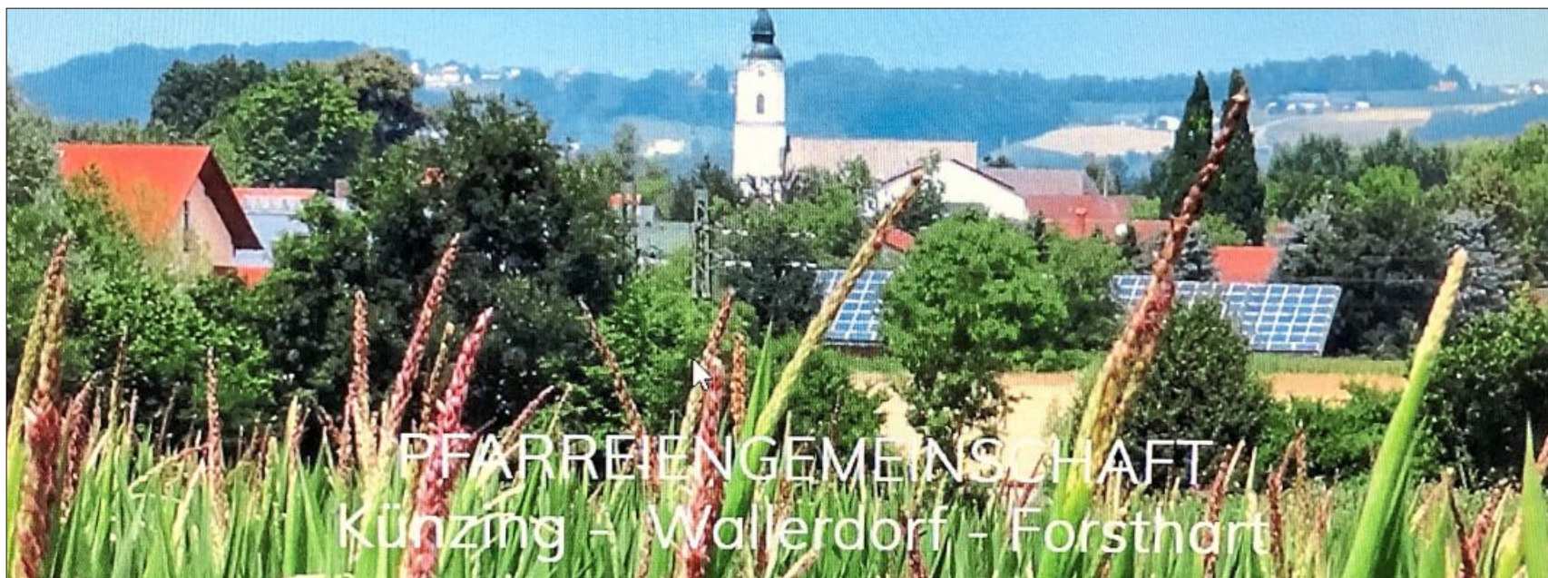
Der Internetauftritt der Pfarreiengemeinschaft birgt nicht nur kirchliches Informationsmaterial.

Gergweis. (red) Die Mitglieder des Frauen- und Müttervereins treffen sich zu einer Kreuzweg-Andacht am Sonntag, 6. März, um 13.30 Uhr in der Pfarrkirche. Anschließend gemütlicher Kaffeenachmittag in der Kerzenstube.